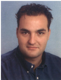
Verehrte Kunden, liebe Kollegen!

Bereits in der IBL Info IV/2004 haben wir Sie über die neue Trinkwasserverordnung informiert. Mittlerweile steht Ihnen diese Verordnung als Download auf unserer Homepage ( www.iblyssoudis.de ) zur Verfügung. In öffentlichen Gebäuden unterliegen Hausinstallationen der Aufsicht durch das Gesundheitsamt. Dieses ist verpflichtet, sich auf der Grundlage von Stichproben Informationen über die Qualität des Wassers zu verschaffen. Es müssen zumindest die Parameter untersucht werden, die sich in Hausinstallationen negativ verändern können.